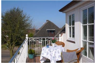
Herzlich willkommen im Haus Andresen