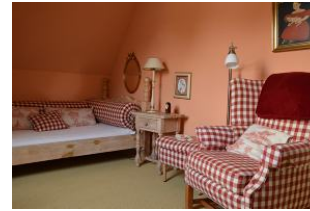
Zweites Schlafzimmer, auch als Rückzugsort ...