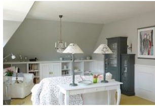
... ausgestattet mit wunderschönen und hochwertigen Möbeln

Das Haus ist umgeben von einem wunderschönen alten Garten mit üppiger Vegetation. Diese luxuriöse 5-Sterne Wohnung, für 2 Personen ,liegt im ersten Stock . Sie sind innerhalb weniger Gehminuten im Zentrum von Wyk und am Strand. Die Wohnung wurde von uns mit besonders viel Liebe zum Detail eingerichtet. Sie ist modern und lichtdurchflutet, strahlt aber gleichzeitig eine große Behaglichkeit aus. Sie verfügt über eine neue, voll ausgestattete offene Küche (z.B. mit Nespressomaschine), ein großzügiges Bad mit Fußbodenheizung, Dusche, Bidet, WC, Föhn