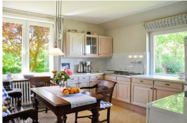
Die geräumige, helle Küche