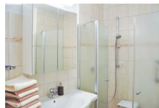
Das Duschbad bietet ausreichend Platz, auch wenn man mal zu zweit duschen will.