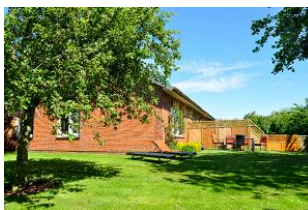
Der Garten: 400 qm nur für den Hausgast zum Entspannen und die Seele mal baumeln lassen.