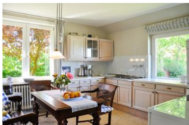
Die geräumige, helle Küche