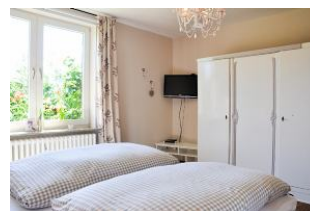
Ein weiterer Fernseher im Schlafzimmer.