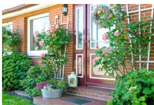
Ihr Eingangsbereich der Haushälfte.