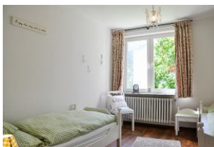
Zwei Einzelbetten im zweiten Schlafzimmer