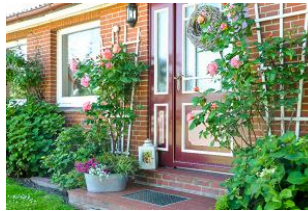
Ihr Eingangsbereich der Haushälfte.