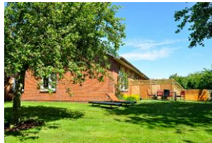
Der Garten: 400 qm nur für den Hausgast zum Entspannen und die Seele mal baumeln lassen.