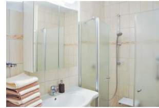
Das Duschbad bietet ausreichend Platz, auch wenn man mal zu zweit duschen will.