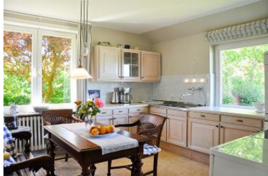
Die geräumige, helle Küche