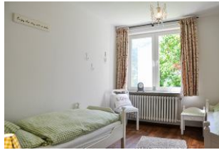
Zwei Einzelbetten im zweiten Schlafzimmer