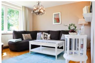
Das gemütliche Wohnzimmer

Für anspruchsvolle Urlaubsgäste der Nordseeinsel Föhr vermieten wir ganzjährig in Dunsum auf Föhr eine komfortabel, neu renoviert praktisch und vor allem auch liebevoll eingerichtete Ferienwohnung in sehr ruhiger Lage direkt auf unserem Bauernhof mit 100 Jungtieren. In unserem Steichelzoo leben Schweine, Ziegen, Kaninchen und Hühner. Unser Hof liegt direkt am Deich von Dunsum. Neben im alten Landwirtschaftsgebäude ist ein Hofladen mit Hofcafe. Auf dem Nachbargrundstück ist unsere Swing-Golfanlage mit 9 Loch - Sie steht unseren Hausgästen kostenlos zur Verfügung. In der Scheune haben wir ein Siku-Modellspielland für Kinder ab 6 Jahren. Mit Ferngesteuerten Landmaschinen können es sich die Kinder auch bei schlechtem Wetter gut gehen lassen. Die liebevoll eingerichtete Wohnung ist komfortabel ausgestattet und bietet dem Gast alles, was für einen ungezwungenen und erholsamen Aufenthalt wichtig und nützlich ist. Hiermit ein kleiner Einblick in die Wohnung, welche vom Platzangebot großzügig bemessen ist. Die Wohnung ist mit Paket und PVC-Böden ausgestattet.