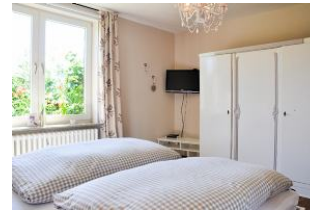
Ein weiterer Fernseher im Schlafzimmer.