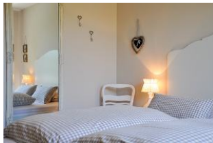
Das Schlafzimmer mit Doppelbett