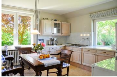
Die geräumige, helle Küche