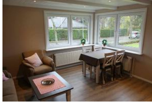
Der neugierige Eßplatz am Fenster