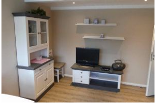
Gemütliches Wohnzimmer mit SAT TV.