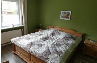
Schlafzimmer mit Doppelbett und Kleiderschrank.