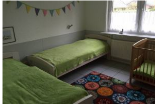
Schlafzimmer mit 2 Einzelbetten und Kinderbett (70x140).