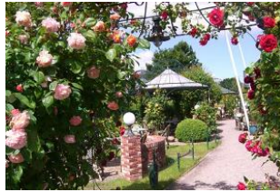
Der Prinzen-Hof mit seinem blühenden Rosen-Garten.