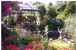
Der blühende Garten des Prinzen-Hofes.

Der Prinzen-Hof liegt auf dem Kurparkgelände, einem der schönsten Inselgrundstücke an der Nordsee. Vom Hause aus erreichen unsere Gäste auf direktem Wege und in wenigen Schritten den Südstrand mit seinem feinen, weißen Sand und seinen bunten Strandkörben. Unsere exklusive "Prinzen-Suite" in maritimem Blau-Weiß hat einen "Rundumblick" nach Norden auf die schöne Lindenallee der Gmelinstraße und nach Süden auf den Nordseekurpark. Dorthin ist auch der eigene Balkon der Wohnung ausgerichtet. Die Einrichtung in elegantem Landhausstil, die Großzügigkeit der Räume und die Bequemlichkeit moderner technischer Ausstattung garantieren unvergessliche Ferien. Diese Wohnung verfügt über Waschmaschine und Trockner. Die "Prinzen-Suite" wurde vom Deutschen Tourismusverband (DTV) mit **** Sternen ausgezeichnet. Prinzen-Hof erhielt das Qualitätssiegel "Service Qualität Deutschland".