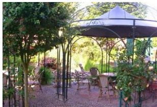
Sitzgruppe im blühenden Café-Garten.